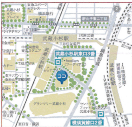
図面と現況が異なる場合現況優先します。

引渡時期 / 平成27年11月中旬 管理形態・管理員 / 全部委託・日勤 管理費 / 住宅管理費9,499円/月・全体管理費11,829円/月 修繕積立金 / 住宅修繕積立金15,234円/月・全体修繕積立金4,122円/月 インターネット接続料・CATV視聴料 / 1,066円/月・330円/月 駐車場 / 空有(別契約要確認) 土地権利 / 所有権 敷地面積 / 9,312.90㎡ 共有持分 / 8,961/6,690,740 総戸数 / 797戸(住宅794戸、その他各1戸×3) 用途地域 / 第二種住居地域 分譲会社 / 三井不動産レジデンシャル株式会社、三井都市開発株式会社 施工会社 / 株式会社竹中工務店 管理会社 / 三井不動産レジデンシャルサービス株式会社